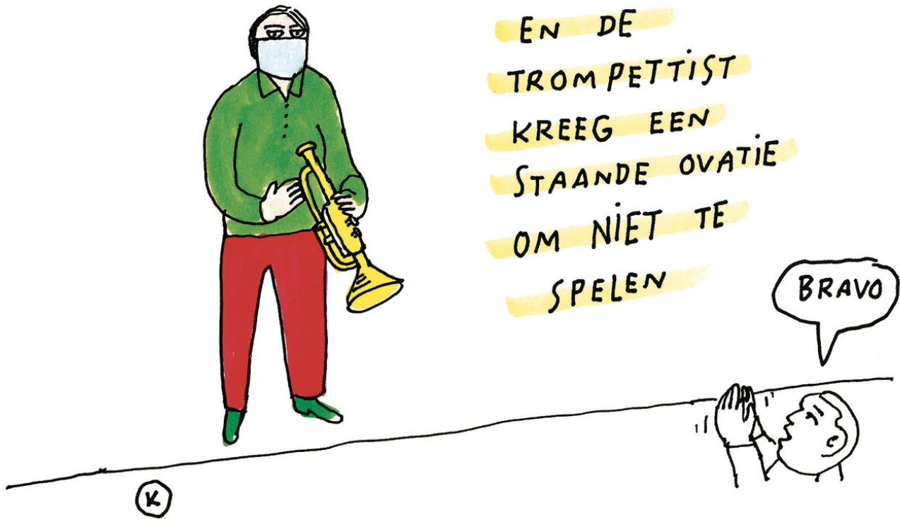
Illustratie Kamagurka 📷

Een aantal zalen laat weten dat het allemaal echt geen zin heeft deze zomer, en sluit de deuren tot september in de hoop op betere tijden. De Domijnen in Sittard bijvoorbeeld, houdt zomerstop. De Tor in Enschede beschouwt 2019-2020 „als afgelopen”. De Boerderij in Zoetermeer kijkt naar 2021 zegt directeur Arie Verstegen, „in de hoop dat er tegen die tijd een vaccin is”. Ook de Heerlense Nieuwe Nor heeft naast livestreams de komende maanden geen publieksactiviteiten. Het grote 013 in Tilburg werkt aan kleinschalige acties om zichtbaar te blijven, maar noemt het verder onverantwoord iets te organiseren, zegt interim-directeur Peter van der Aalst. „Zonder extra steun zouden we dan alleen maar meer kosten maken.”